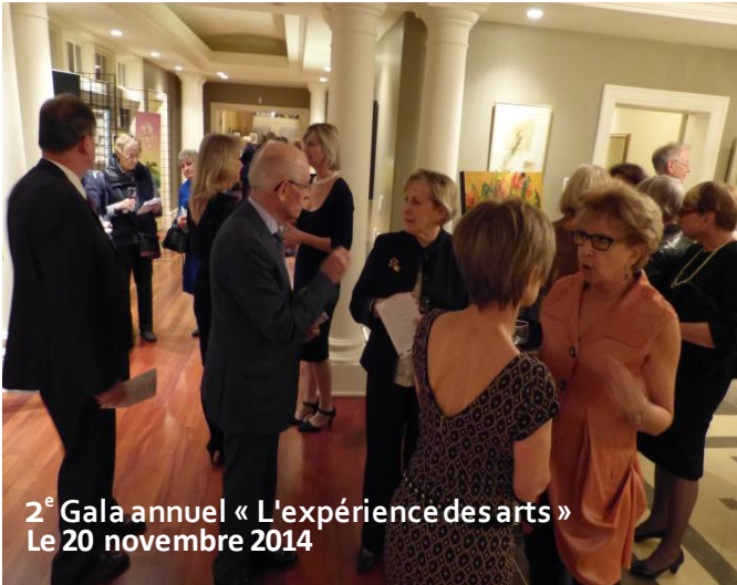
2 e Gala annuel « L'expérience des arts » Le 20 novembre 2014