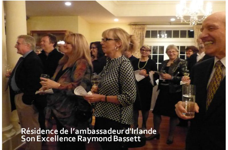
Résidence de l'ambassadeur d'Irlande Son Excellence Raymond Bassett