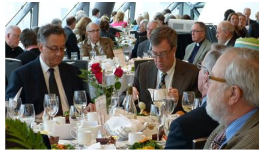
Déjeuner annuel du printemps – 30 avril 2014

Le CSE a pour mandat, à la fois, de sensibiliser les personnes âgées aux questions du vieillissement, de les tenir informées, de les inciter à demeurer des membres actifs de leur collectivité et d'assurer la planification et la mise en œuvre des Déjeuners-causeries et des Conférences d'enrichissement personnel . De plus, le comité recrute et gère un noyau de bénévoles dévoués et aptes à répondre aux besoins logistiques du Conseil sur le vieillissement d'Ottawa (CSV).