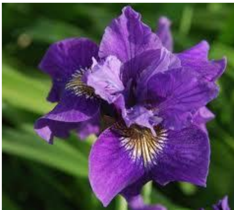
Les sympathisants sont encouragés à porter la couleur pourpre pendant la Journée internationale de prise de conscience sur la violence faite aux aîné(e)s - le 15 juin

restructurée. En cas d'absence d'élément criminel, ceux qui appellent sont désormais transférés à l'Unité d'aide aux victimes (UAV), ce qui a permis à la Section contre la violence à l'égard des aînés du SPO de travailler en « temps réel » sur des cas qui peuvent être attribués aux enquêteurs en deux jours. L'UAV s'occupe désormais de la « ligne prioritaire » afin de libérer les enquêteurs. La ligne pilote 211 continuera de recueillir des statistiques sur la violence faite aux aînés en utilisant l'outil spécial de collecte de données que le GICMEPA a élaboré en collaboration avec cette section. L'intérêt continue à être marqué pour la prestation de nouvelles séances de formation permettant de faciliter le signalement de mauvais traitements infligés aux aînés et d'apprendre aux coordonnateurs de la prévention des violences faites aux aînés à utiliser la base de données 211.