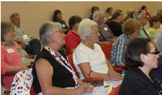
5 e Conférence annuelle sur la spiritualité et le vieillissement : L'esprit s'affine – 4 juin 2014

Les bénévoles ont aussi prêté main forte au Forum « Choix et défis du transport dans une communauté multiculturelle » organisé par le Comité du transport des aînés d'Ottawa, au Gala culturel du CSV de même qu'aux Déjeuners-causeries et Forum annuel planifiés par le Comité directeur des affaires francophones. Des membres de notre comité ont représenté le CSV à diverses foires et activités publiques et ont aussi participé, en collaboration avec le personnel de l'organisme, à la conception du matériel publicitaire et à l'actualisation des brochures et de la bannière du CSV.