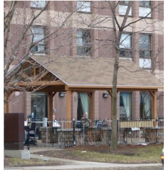
Les logements accessibles et abordables sont une priorité pour les aînés

Le comité est aussi en train d'actualiser le « Répertoire des logements et résidences pour personnes âgées » que le CSV a publié et maintes fois mis à jour en collaboration avec la Ville d'Ottawa.