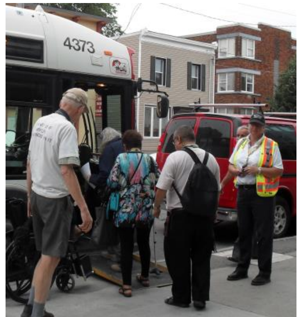
Des passagers montent dans un autobus accessible d'OC Transpo

Le sous-comité du Transport en milieu rural défend la création d'un système de transport abordable et humain pour les personnes âgées et les handicapés qui vivent dans les régions rurales d'Ottawa. Il a assuré le suivi des Services de soutien des communautés rurales et du Programme de taxis