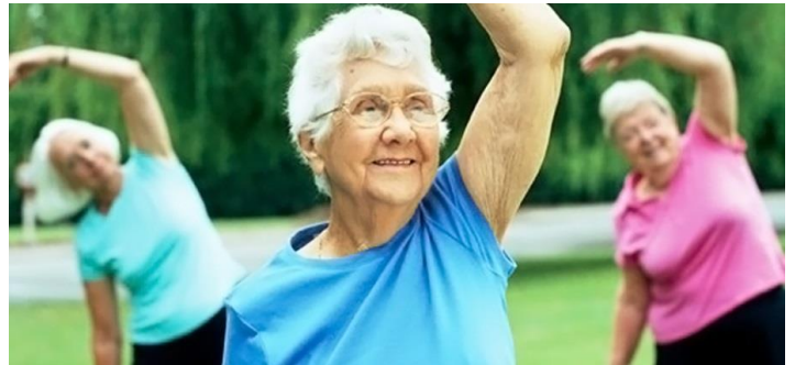
Les personnes âgées : Vivre mieux et plus longtemps