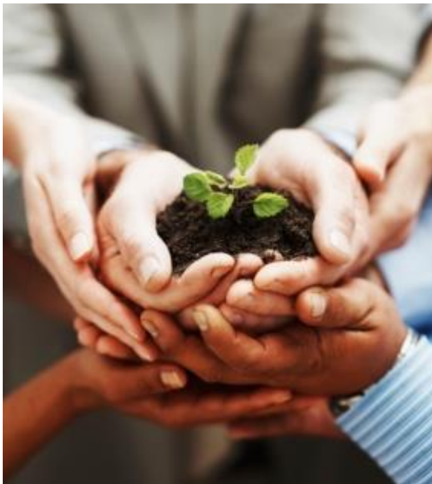
Créer Ottawa, ville-amie des aînés

Le Plan d'action : Ottawa ville-amie des aînés 2013-2014 , publié en juillet 2013, a défini les objectifs à atteindre afin d'améliorer la santé et le bien-être des personnes âgées d'Ottawa par le biais d'une action communautaire axée sur la collaboration et l'implication des aînés, elle-même basée sur leurs priorités dégagées lors d'un processus de consultation publique. Des 17 actions communautaires spécifiques, 12