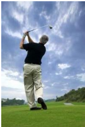
Le premier tournoi annuel de golf du CSV – le 12 septembre 2014

Plusieurs initiatives de communication ont été mises en oeuvre durant l'année afin d'informer régulièrement les aînés, les membres du CSV, de même que ses commanditaires et partenaires communautaires des nombreux projets et activités réalisés par l'organisme. Nous avons notamment lancé un bulletin de nouvelles électronique mensuel et bilingue appelé La Toile/The Prime Times qui est acheminé par courrier électronique à plus de 4 000 personnes à la fin de chaque mois; actualisé le contenu du site Web du CSV pour indiquer clairement les initiatives et réalisations de chaque comité du CSV; effectué d'autres mises à jour du site Web pour encourager les inscriptions en ligne aux activités organisées par le CSV et pour actualiser la base de données; créé une page Facebook pour diffuser les activités organisées par le CSV et ses organismes partenaires; et, enfin, utilisé Google Analytics pour connaître le nombre de visiteurs du site Web afin de compiler des données que le CSV peut ensuite communiquer à des publicitaires et commanditaires potentiels.