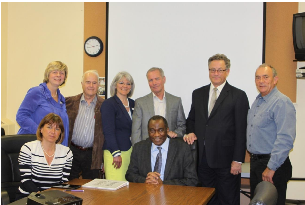
Chisanga Puta-Chekwe, sous-ministre du ministère des Affaires civiques et de l'Immigration, sous-ministre responsable de la Condition féminine et sous-ministre responsable des Aînés et le personnel du ministère des Affaires civiques et de l'Immigration de l'Est de l'Ontario rencontrent des membres du Conseil d'administration du CSV à nos bureaux – le 5 juin 2014